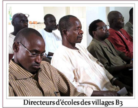
Directeurs d'écoles des villages B3