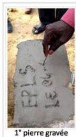
1 o pierre gravée

Après le reboisement les 14 et 15 Mai derniers respectivement des écoles de Ndiaoudoune et de Thilène avec la collaboration de nos partenaires les Brigades Vertes , le coup d'envoi a également été donné pour les constructions d'une salle de classe et de sanitaires pour les filles par une cérémonie de pose de la première pierre effectuée par Dr Gilles Riveau le lundi 04 juillet au sein de l'école de Ndiaoudoune. La population et les autorités villageoises en tête se sont mobilisées pour accueillir l'équipe de EPLS et participer activement à la manifestation.