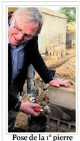
Pose de la 1 o pierre

Les projets villageois devant améliorer les conditions de vie des enfants des villages impliqués dans le projet Bilhvax3 présentent trois volets d'actions. Ces actions s'appliquent à l'amélioration de l'environnement, les conditions d'éducation et celles de la dispensation des soins médicaux.